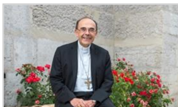
L'archevêque Mgr Philippe BARBARIN