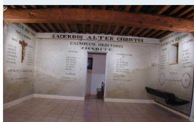
Tableau de Saint-Fons © Prado