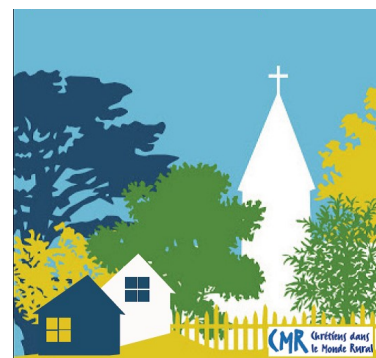
Visuel : CMR

Samedi 2 octobre 2021 de 9h à 14h à la salle des fêtes des Olmes (près de Tarare)