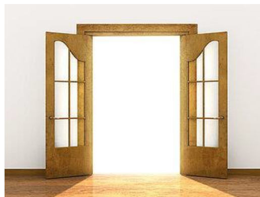
Clipart libre de droit : Porte Ouverte