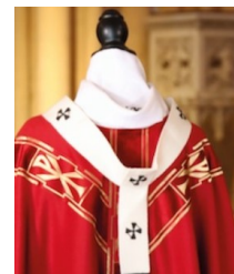
Visuel diocèse de Lyon

D'après Vatican News et lyon.catholique.fr