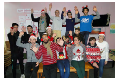
Les jeunes de l'aumônerie, veillée de Noël 2022