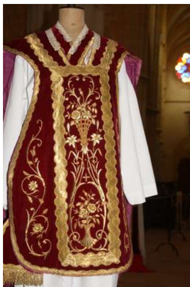
Une chasuble romaine

Cette exposition a été réalisée en lien avec l'association « Les amis de Monseigneur Odin ».