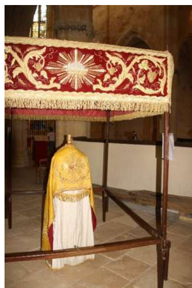
Le dais des processions La chape et le voile huméral portés par le célébrant