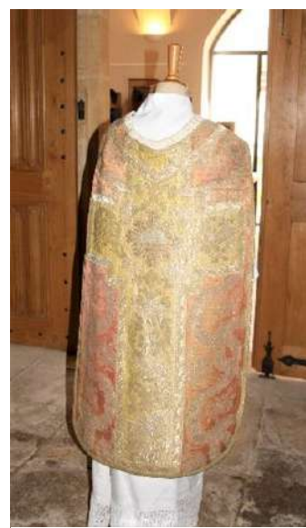
Chasuble portée par Monseigneur Odin