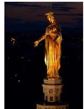
ND de Fourvière