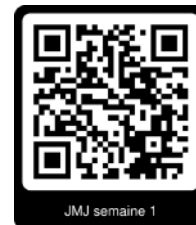
JMJ semaine 1