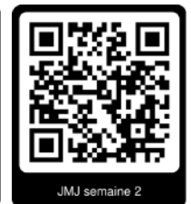
JMJ semaine 2

Flashez ces QR codes pour plus de photos des JMJ de Lisbonne !