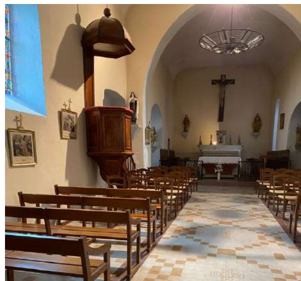
Le chemin de croix de la charmante église de Vivans